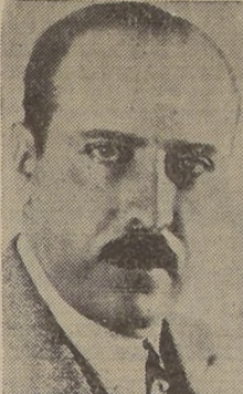
El Dr. Carlos Arroyo del Río, quien se ha refugiado en la Embajada de EE. UU., después de resignar sus altas funciones.