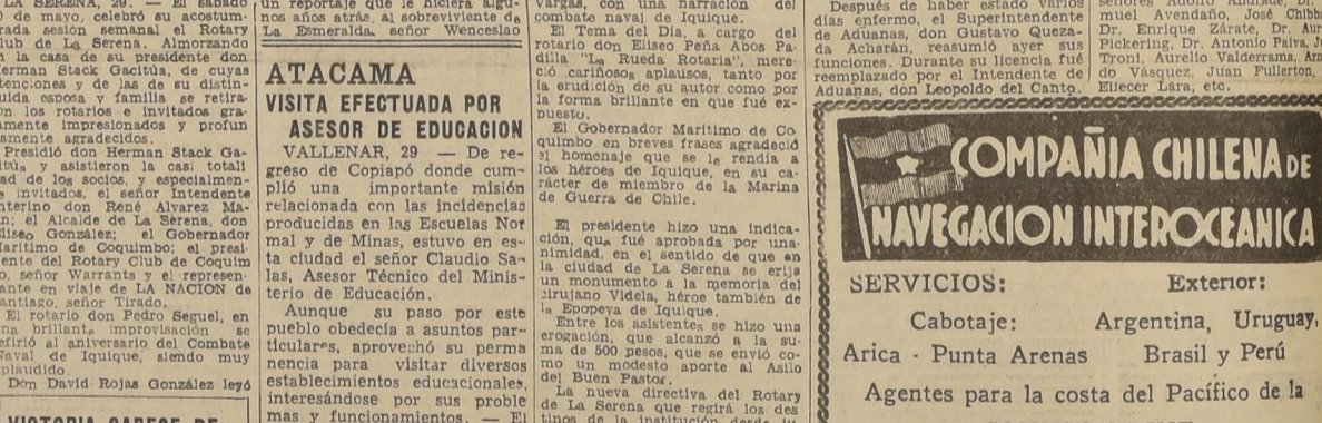
EL ROTARY CLUB DE LA SERENA

SANCHEZ FONTECILLA 1242 Ofrecer toda clase de plantas frutales, forestales y para jardín. Almacén de flores, tierra de hojarasca, químicos, etc.