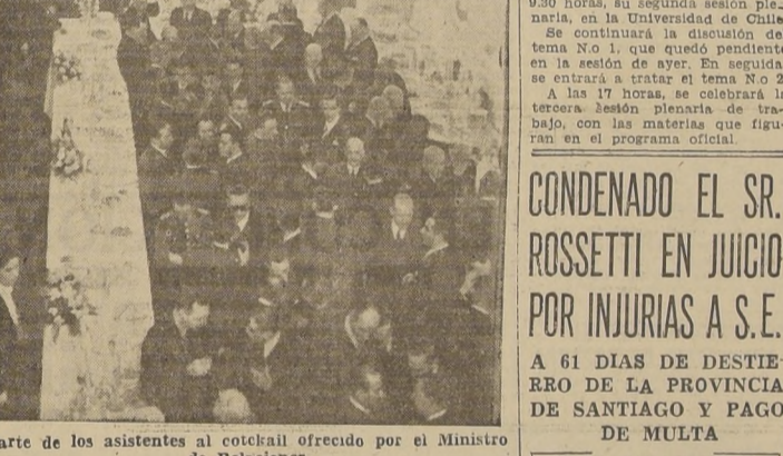
Parte de los asistentes al cocktail ofrecido por el Ministro de Relaciones.