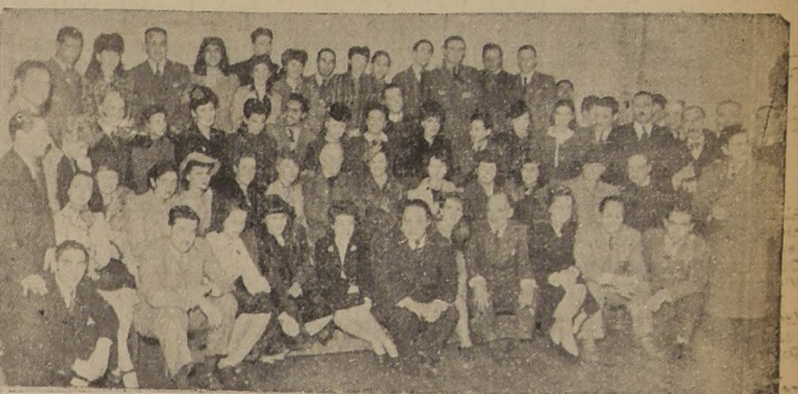
Asistentes a la manifestación ofrecida por los alumnos de la Escuela de Bellas Artes, al profesor don Pablo Burchard, con motivo de haber sido distinguido con el Premio Nacional de Arte, y que constituyó una elocuente demostración de las simpatías de que el Sr. Burchard goza entre el alumnado, que ha recibido regocijadamente el reconocimiento de sus méritos por el Jurado del Premio Nacional de Arte.