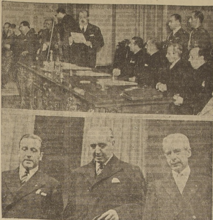
El delegado uruguayo habla en nombre de los delegados extranjeros, en la sesión inaugural. — S. E. acompañado del Ministro de Justicia y del presidente del Congreso de Criminología, se retira del Congreso Nacional.