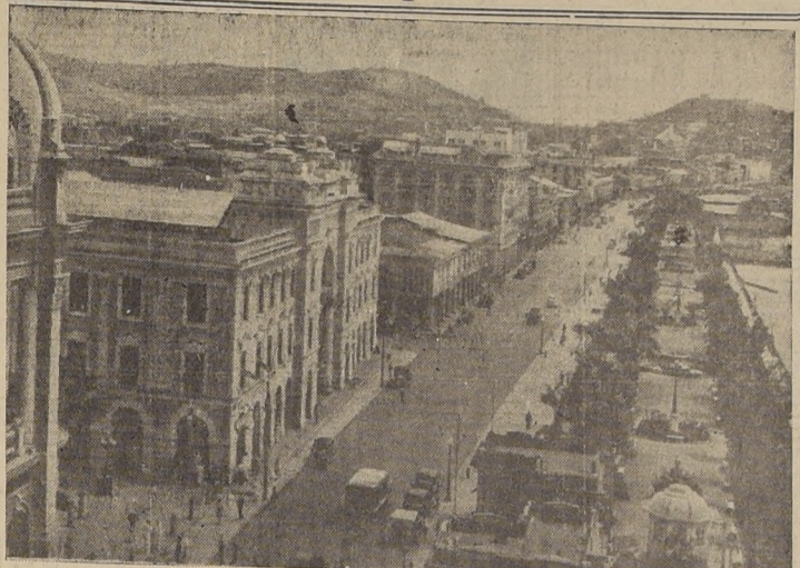
Guayaquil. — Pasco de las Colonias.