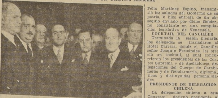
Parte de los asistentes al cocktail ofrecido por el Ministro de Relaciones.