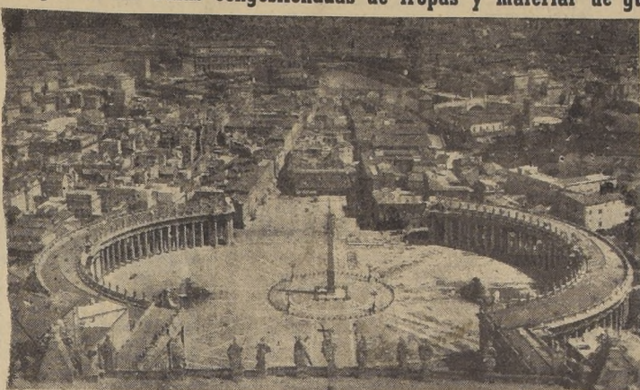
Roma, vista desde la cúpula de San Pedro

La entrada a Roma se produjo con dramática rapidez, después que las tropas del general Clark, precedidas por fuerzas blindadas norteamericanas, hicieron trizas las últimas defensas alemanas de Roma, en los cerros Albano. El avance final cubrió 24 kilómetros, en 24 horas, siendo tan rápido en los últimos tramos, que se cree han sido encerrados en diversos bolsos muchas tropas alemanas.