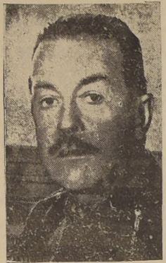
General Sir Harold Alexander.

La importante línea en la Ribera, al sur de la costa, fué atacada en el viaducto al sudoeste de Cannes, y asimismo el "Arriba", el cual decía que la batalla por la posesión de Roma es "meramente asunto de prestigio", añadiendo que no podía esperarse en Italia "ninguna batalla de importancia decisiva".