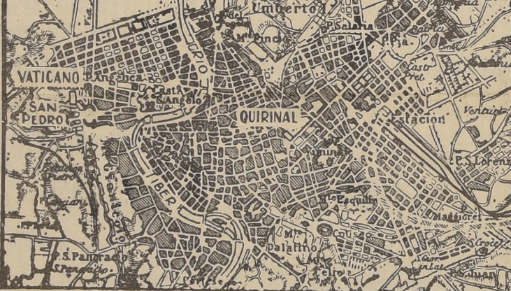
Plano parcial de Roma y de algunos de sus alrededores. Las fuerzas del 5.º Ejército americano que comanda Mark Clark entraron a la ciudad por la Via Cassilina (ángulo inferior, a la derecha).

El Quinto Ejército inició a las 11 A. M. su ataque de artillería contra los tanques, posiciones de baterías, antitanques y morteros alemanes estacionados en torno a la ciudad. La mayoría de la infantería norteamericana que escoltó a los tanques en el más rápido avance de la campaña italiana, a lo largo de la Via Cassilina, adornaron sus cascos con plumas verdes y rojas, al estilo indio. Tanques alemanes se congregaron preciblemente bajo un letrero que decía "Roma", tratando de retardar el avance aliado. Vi un tanque alemán que estallaba en llamas al ser alcanzado por un impacto directo.