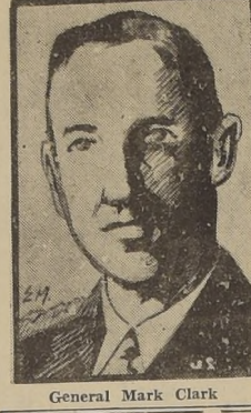
General Mark Clark