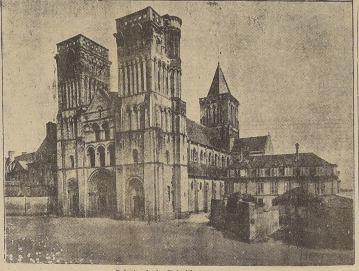
Iglesia de la Trinidad en Caen

COMANDO SUPREMO DE INVASION, 8. (U. P.).— (Por Virgil L. Pinkley).— Los ejércitos aliados han completado con todo éxito la primera fase de la invasión de Francia, y ya se han lanzado a la batalla para destruir las reservas móviles que los alemanes han enviado al frente de operaciones. Con ello la lucha en Normandía se ha ampliado y en muchos sectores se libran sangrientos combates, pues los alemanes recurren cada vez más a elementos blindados. Tal es el último anuncio del cuartel general de Eisenhower, mediada esta tarde.