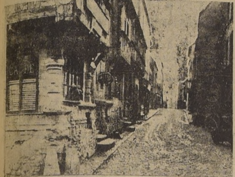
Una calle del histórico pueblo de Bayeux, recientemente conquistada por las fuerzas de Montgomery. Sus unidades mecanizadas han avanzado más de 10 kilómetros al sur de dicha población y en estos momentos marchan en demanda de Saint-Lo.

4.000 O 5.000 PRISIONEROS HAN TOMADO LOS ALIADOS