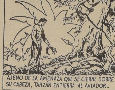
AJENO DE LA AMENAZA QUE SE CIERNE SOBRE SU CABEZA, TARZAN ENTIERRA AL AVIADOR.