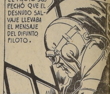
EL PILOTO SOPRECHÓ QUE EL DESNUDO SALVAJE LLEVABA EL MENSAJE DEL DIFUNTO PILOTO.