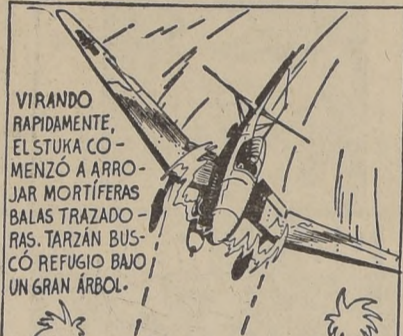
VIRANDO RAPIDAMENTE, EL STUKA COMENZÓ A ARROJAR BALAS MORTIFERAS...