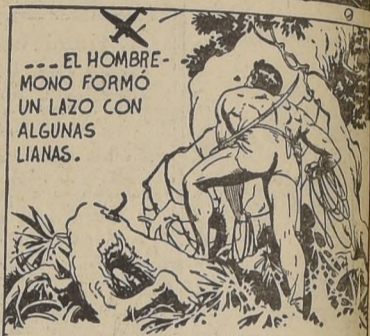
EL HOMBRE MONO FORMÓ UN LAZO CON ALGUNAS LIANAS.