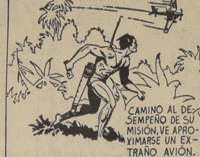
CAMINO AL DESPEÑO DE SU MISION, VE APROXIMARSE UN EXTRAÑO AVION.