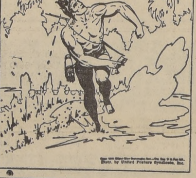
EL AEROPLANO VOLVIÓ A LA CARGA, PERO TARZAN ESTABA YA LISTO CON SU FLECHA...