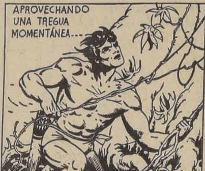
APROVECHANDO UNA TREGUA MOMENTÁNEA...