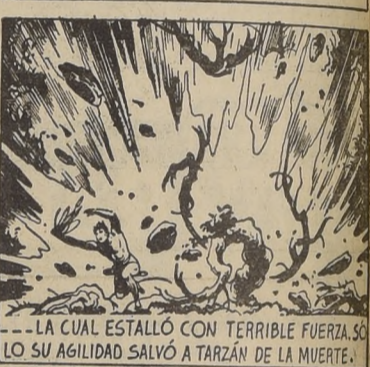
LA CUAL ESTALLO CON TERRIBLE FUERZA, LO SU AGILIDAD SALVÓ A TARZAN DE LA MUERTE.