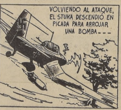
VOLVIENDO AL ATAQUE, EL STUKA DESCENDIÓ EN PICADA PARA ARROJAR UNA BOMBA...