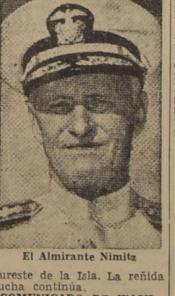
El Almirante Nimitz

sureste de la Isla. La refuella lucha continúa. COMUNICADO DE WASHINGTON El texto del comunicado, que fué expedido simultáneamente en Washington, dice: "En la tarde del 19 de junio, aviones de reconocimiento con base en portaaviones de la 5.ª Flota, avistaron la flota japonesa que incluía portaaviones y acorazados, aproximadamente a mitad de distancia entre las Islas Marianas y Luzón. Aeroplanos de nuestra fuerza rápida de combate de portaaviones, recibieron inmediatamente la orden de atacar e hicieron contacto con el enemigo antes del anochecer. Las pérdidas enemigas y las nuestras, no han