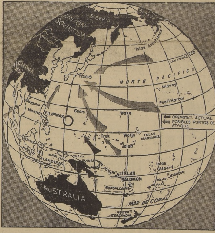
El círculo muestra el sector del Pacífico donde se han trabado en batalla grandes fuerzas aeronavales de Estados Unidos y el Japón.

Luzón está al extremo norte de las Filipinas, y aparentemente el encuentro aeronaval se efectuó a unas 850 millas de la cabecera de la península norteamericana en Saipan, en las Marianas, en donde se anuncia que las tropas norteamericanas avanzaron hacia el norte sobre la orilla occidental de Bahi Magicienne y hicieron progresos contra la fortificación japonesa en Punta Nafutan, esquina