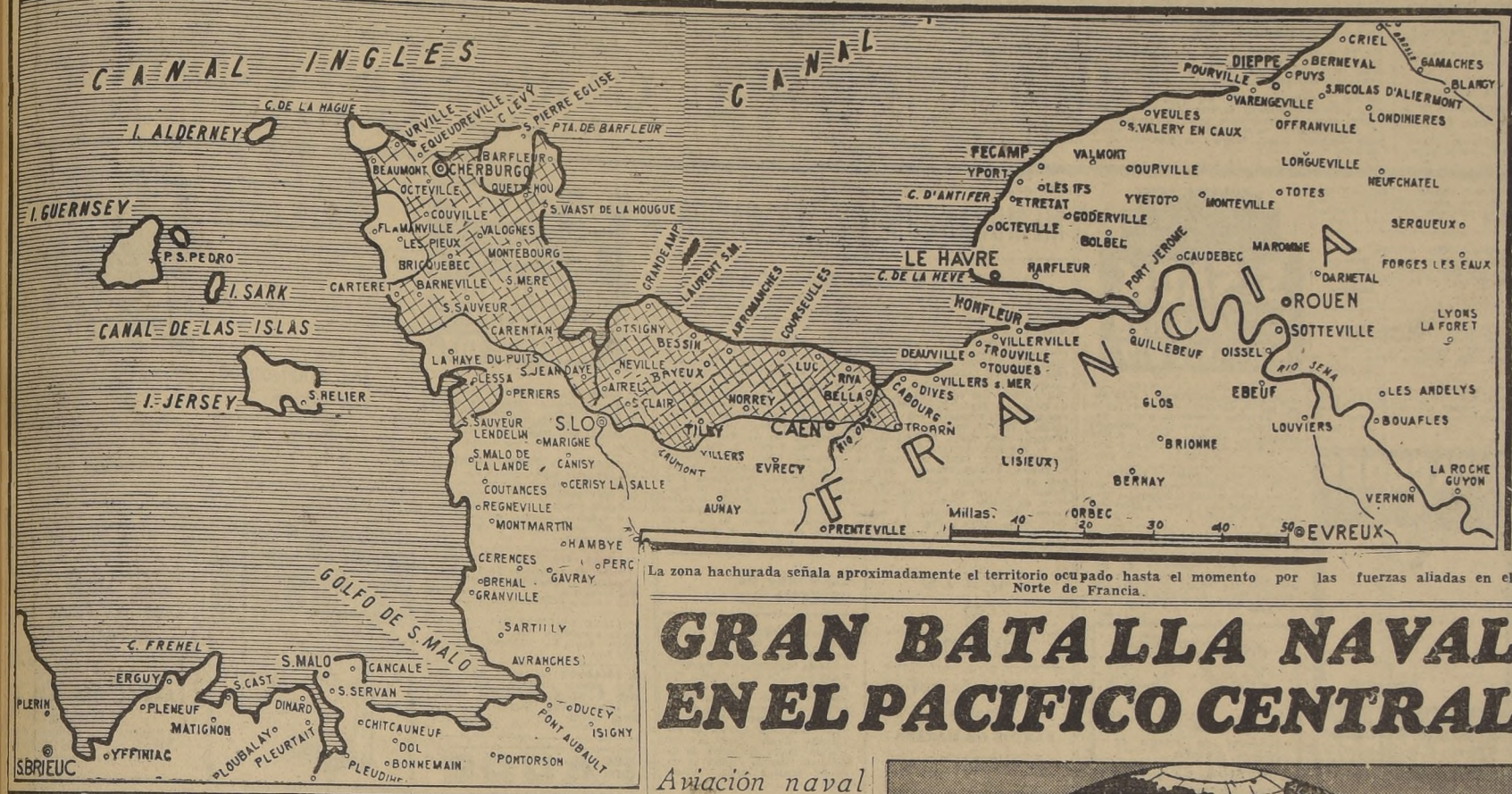
La zona hachurada señala aproximadamente el territorio ocupado hasta el momento por las fuerzas aliadas en el Norte de Francia.

Americanos aprietan el cerco en torno de la ciudad.- Alemanes habrían comenzado a desalojarla