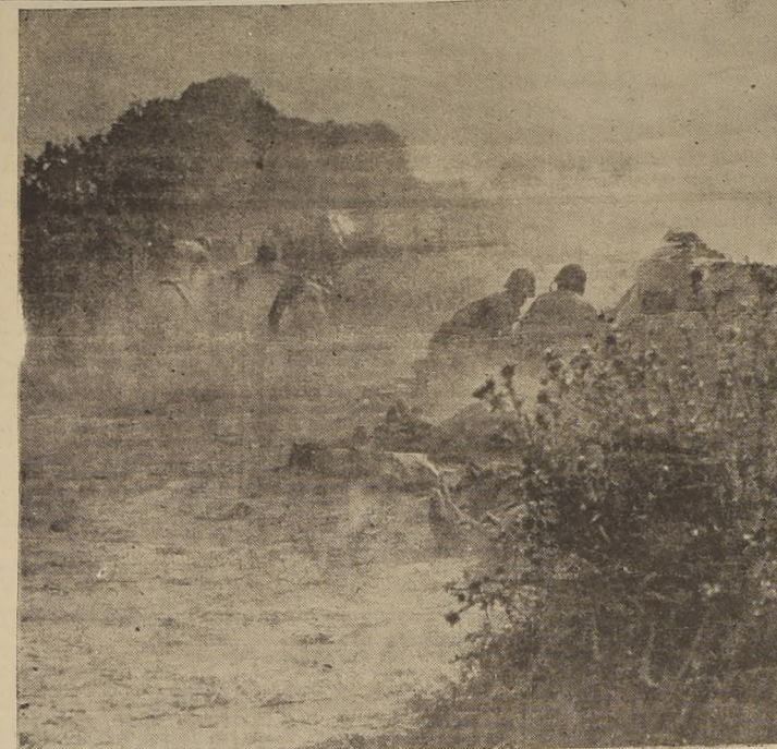
En esta sensacional instantánea vemos a un grupo de infantes norteamericanos tomando posiciones detrás de una pared semiderruida, mientras un cañón antitanque dispara sobre las fuerzas mecanizadas enemigas que avanzan sobre ellos. La fotografía fue captada en un lugar de Normandía.

ASIA SUROCCIDENTAL.—Las fuerzas británicas capturaron Dibrui.