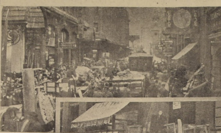
Los aspectos del lanzamiento de ayer