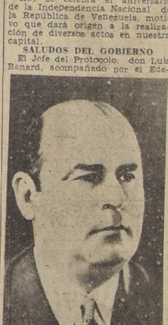
Excmo. señor General Isaias Medina A., Presidente de Estados Unidos de Venezuela.

Este día, el 5 de julio la República de Venezuela celebra su más glorioso aniversario. Que es un deber de la juventud audaz mantener latente el sentimiento de fraternidad y solidaridad de los pueblos de América.