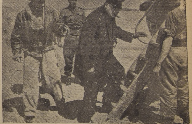
Cuando el Primer Ministro de G. Bretaña realizó en un jeep su famosa jira de inspección por el frente de Normandía, fue recibido y aclamado con entusiasmo en toda partes, pero se tuvo a punto de ser muerto por un franco-tirador alemán. Mientras departía con el general Montgomery en una pequeña plaza de una aldea normanda, un rifle cayó desde un árbol situado a poco más de cien metros del sitio. Obligado a descender, el alemán explicó que el temor de ser hecho pedazos, paralizó su mano sobre el disparador. Y le hizo perder el motor blanco de su vida.