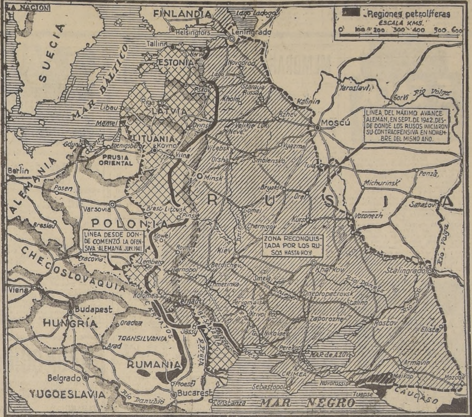
El presente mapa señala las operaciones en Rusia, desde su comienzo en junio de 1941 hasta hoy día. La línea dentada señala, al oeste, los puntos desde los cuales las fuerzas del Reich iniciaron la gran invasión, y la línea cortada, situada muy al este, indica el máximo avance alemán hasta septiembre de 1942. En noviembre del mismo año, los rusos emprendieron la contraofensiva que los ha llevado desde Stalingrado a Kowel, reconquistando la enorme área señalada por las rayas oblicuas. La línea gruesa, finalmente, corresponde al actual frente de lucha. La parte cuadriculada, a la izquierda de dicha línea, señala el territorio que les falta por reconquistar a los rusos, para volver a las fronteras de junio de 1941.

Poco antes de darse a conocer esta grave admisión por los ejércitos nazis, el comentarista Kurt von Hammer, de la Deutsches Nachrichten Büro, había dicho que la lucha se había ampliado ayer a las zonas de Lutsk (Luck) y Tarnopol, logrando los ejércitos atacantes una "irrupción local" al oeste de Lutsk y a 68 kilómetros al suroeste de Kowel, en la región sudcentral de Polonia. La DNB, por su parte, había expresado que el avance soviético era "de gran importancia".