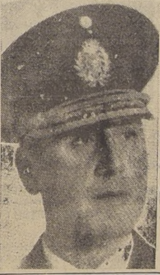
El coronel Juan Domingo Perón ha sido designado vicepresidente de la nación, cargo que desempeñará conjuntamente con la cartera de guerra, para la que fue designado, tiempo atrás.