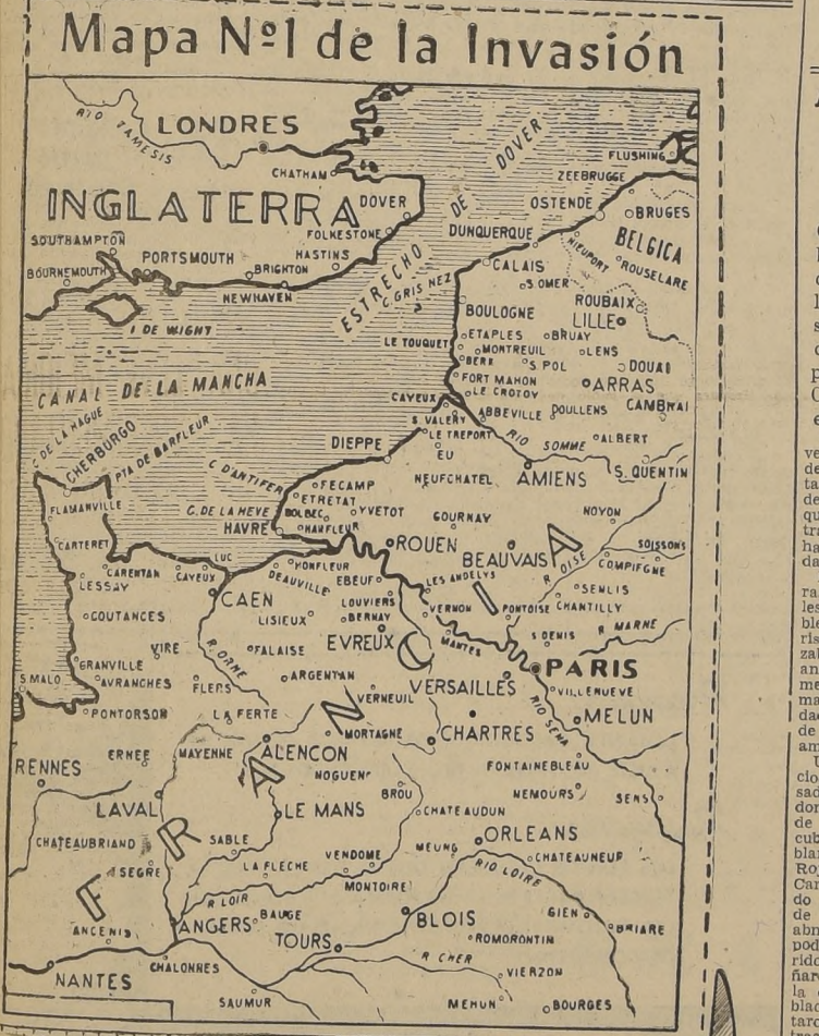
MAPA DEL SERVICIO FOTOGRAFICO DEL DOTO BRITANICO DE INFORMACIONES