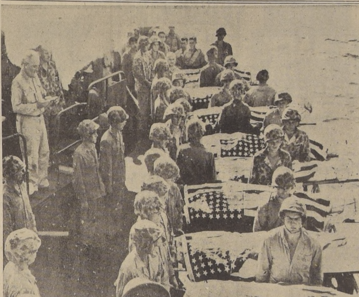
Un capellán de las fuerzas armadas oficia un servicio religioso a bordo de una lancha de desembarco, por el descanso de los infantes de Marina, caídos en la dura lucha por la posesión de Saipan. Las pérdidas norteamericanas en esta batalla fueron tres veces superiores a las experimentadas en Tarawa.