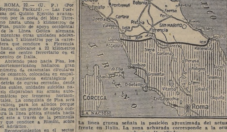
La línea gruesa señala la posición aproximada del actual frente en Italia. La zona achurada corresponde a la ocupada por los aliados.

El 5.º Ejército conquistó Castel Fiorentino.—Fuerzas italianas ocuparon Belvedere ROMA, 22.—(U. P.).—(Por Reynolds Packard).—Las fuerzas del Quinto Ejército avanzaron por la costa del Mar Tirreno hasta unos 5 kilómetros de Pisa, punto de apoyo occidental de la Línea Gótica alemana, mientras otras unidades adelantaban 7 kilómetros por la carretera que conduce a Florencia hasta colocarse a 22 kilómetros de ese centro ferroviario en el centro de Italia.