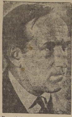
Don Arturo Matte Larraín, Ministro de Hacienda

En las últimas horas de la tarde de ayer conversamos con el Ministro de Hacienda, señor Matte Larraín, quien refiriéndose a su exposición hecha en el Consejo de Gabinete, sobre el estudio de la Hacienda Pública, nos expresó: "Di a conocer todas las cifras relacionadas con las finanzas nacionales e hice presente la necesidad de ajustarse a un severo plan de economías".