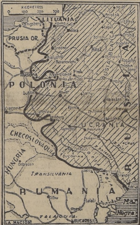
Las fuerzas rusas, en su arrollador avance, se aproximan rápidamente a las líneas alemanas a lo largo del Vístula al mismo tiempo que amplían el frente hacia Varsovia y luchan en las calles de la gran fortaleza de Lwow (Lemberg). La línea gruesa señala aproximadamente la posición actual de la línea de batalla.

HABRIA COMENZADO LA BATALLA POR ESTONIA. La fuerza aérea soviética, que