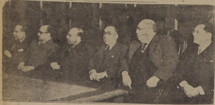
Mesa directiva del acto

En la Universidad de Chile se llevó a efecto en la tarde de ayer, la velada solemne del Círculo de amigos de la cultura árabe, en celebración del tercer aniversario de su fundación.