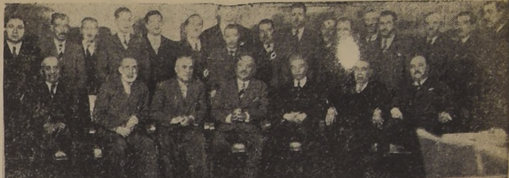
Comida en honor del Ministro del Irán en Chile, ofrecida en el Savoy por la Unión Musulmana