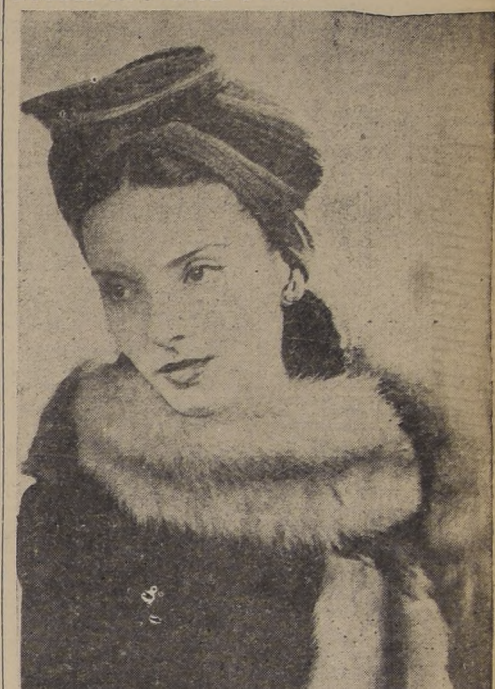
Nueva versión del gracioso Turban que contribuye altura extra y ancho moderado. Drapedo con tejidos de lana y rayón en colores oscuros.