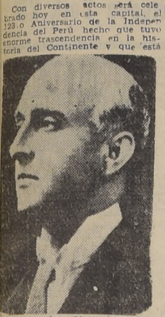
Excmo. señor Manuel Prado, Presidente del Perú

CORDIAL MENSAJE DE LA U. DE MUNICIPALIDADES DE CHILE A SUS COLEGAS DE LIMA