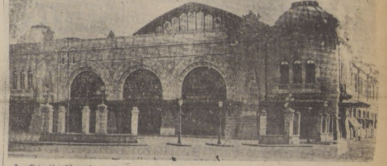
La Estación Mapocho, que será substituída por la moderna Central Ferroviaria

SERA CONSTRUIDA EN EL PLAZO DE CINCO AÑOS Y SE INVERTIRAN VARIOS MILLONES DE PESOS