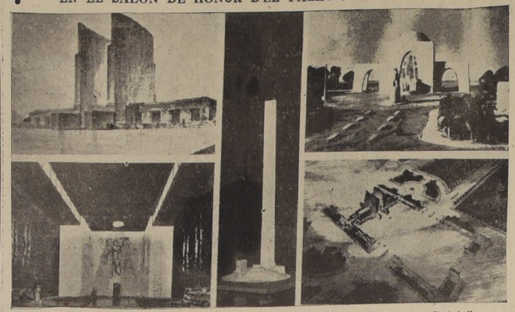
Algunos de los trabajos presentados en el concurso del "Santuario de la Patria", y que se exhiben en el Salón de Honor de la Moneda.

El concurso abierto por la Presidencia de la República para obtener la participación de nuestros arquitectos y artistas en el proyecto de monumento pro Santuario de la Patria, ha sobrepasado todas las expectativas. En efecto, a pesar del corto plazo, la concurrencia de participantes ha sido muy numerosa, lo que se considera un verdadero éxito.