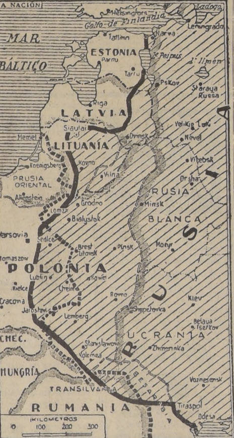
La línea gruesa señala, aproximadamente, el frente de batalla ruso-alemán, de acuerdo con las últimas informaciones. — La línea cortada indica la frontera desde la cual los ejércitos del Reich iniciaron la invasión de Rusia.