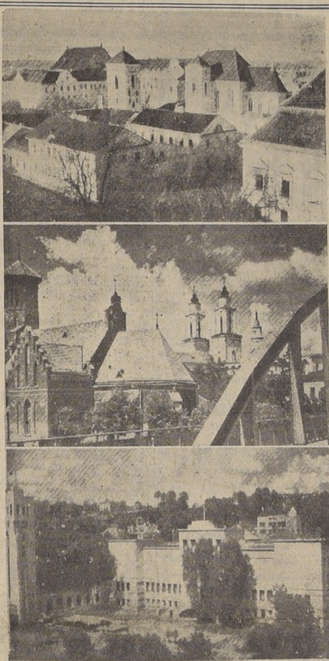
Algunos aspectos de Kaunas o Kovno, capital de Lituania, que en estos momentos debe estar siendo ocupada por los ejércitos rusos

ROMA 28 (U. P.). — (Por Reynolds Packard). — Las tropas aliadas avanzaron hoy a las 10.00 horas a ocupar cuatro poblaciones, con lo que quedaron a 10 kilómetros y a tiro de cañón de esa ciudad; en el otro extremo del frente británico, las unidades polacas que operan en el flanco del Adriático, forzaron el paso del río Misa, 22 kilómetros al norte de Ancona.