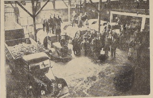
Camiones del Servicio de Aseo, de la Tercera Zona estacionados por falta de combustible

POR FALTA DE BENCINA SOLO PUDO MOVILIZARSE EL CINCUENTA POR CIENTO DE LA DOTACION DE CAMIONES