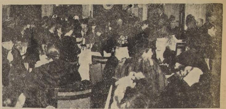
Un grupo de las personas asistentes al Té-Bridge a beneficio de la Cruz Roja Belga, efectuado en los amables salones del Hotel.