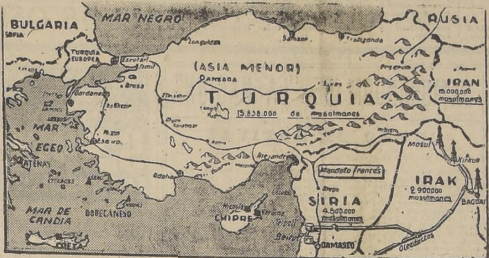
La ruptura de relaciones de Turquía con Alemania, que puede ser el preludio de su entrada a la guerra, tendrá hondos repercusiones en los Balcanes, tanto por su posición geográfica como por sus fuerzas relativamente poderosas. Se calcula que Turquía podría inmovilizar por lo menos a 5 divisiones alemanas.