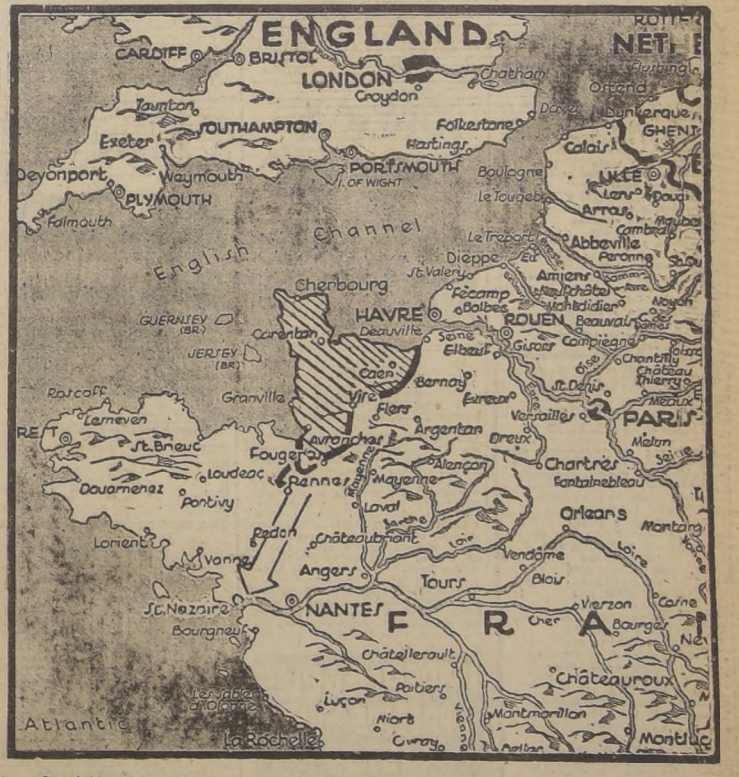
La rápida marcha de las fuerzas aliadas en Bretaña, tiene como objetivo principal la ocupación de las bases navales de Brest, Lorient y Saint Nazaire, que sirven de refugio a los submarinos alemanes que operan en el Atlántico. El avance hacia Brest y Saint Nazaire, que amenaza rodear a los defensores de la península, los obligará a replegarse o a sufrir las consecuencias del cerco y la aniquilación.

COMANDO SUPREMO ALIADO, jueves 3. — (U. P.). — POR PHIL AULT. — Se ha informado que las columnas de tanques norteamericanos avanzan hoy sobre Rennes hacia Brest, sin hallar resistencia, habiendo adelantado casi 48 kilómetros en 24 horas, en tanto que la derrota alemana se extiende sobre el frente francés 80 kilómetros.