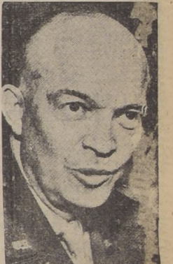
El general Eisenhower, comandante supremo de las fuerzas de invasión, quien ha trasladado su cuartel general desde Inglaterra a los campos de batalla del norte de Francia.