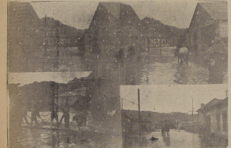
Las calles Fortales y Serrano del puerto de Tomé convertidas en verdaderos ríos por efecto de las inundaciones. Puede apreciarse la altura que alcanzó el agua al desbordarse por las calles de la población, inundando las numerosas casas, en su mayoría de construcción ligera.

TOME. — El violento temporal de lluvia y viento que se ha batido en la zona central y sur del país, afectado en forma grave a la ciudad de Tomé, especialmente en los Barrios Norte, Egeña y Alifanque.