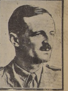
El general Leclerc fuerzas opera la Segunda División Blindada del ejército francés, al mando del legendario general Leclerc.

Los cuatro ejércitos que atacan al enemigo operan así: por el oeste ataca el Primer Ejército norteamericano al mando de Bradley, proyectándose desde el sector de Mortain. Los canadienses atacan directamente desde el norte. Entre los dos, y en ocasiones a una distancia media de ocho kilómetros de cada flanco, el Segundo Ejército británico al mando del general Dempsey embiste contra las líneas enemigas a tres kilómetros de Coudré-sur-Loire, localidad situada sobre el camino secundario que empalma con la carretera de Falaise, por donde se retiraron los alemanes. Por su parte, los columnas del Tercer Ejército norteamericano, cuya presencia en Francia se reveló hoy, opera al mando del teniente general Courtney H. Hodges, desde el sur para completar el cierre de la trampa, y una de esas fuerzas era la que estaba esta noche a 15 kilómetros de Falaise, si bien no lo confirmó oficialmente el Comando. Con estas últimas