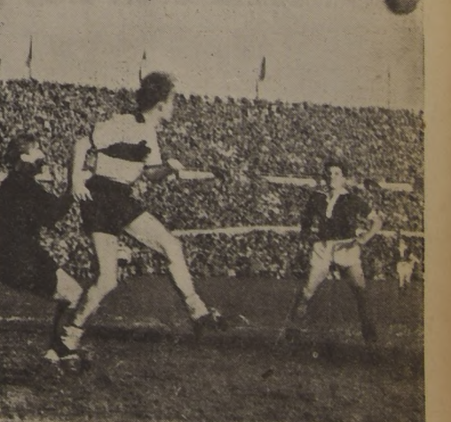
REEMPLAZO BIEN.—Vicuña cabecea impidiendo así que intervenga su arquero. El reemplazante de Buccicardi cumplió bien su papel. Parece que le sienta mejor el puesto de back que el de half