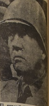
El general Patton, comandante del III Ejército norteamericano...