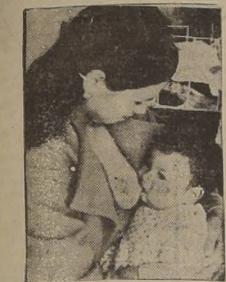
LABOR SOCIAL DE CAUQUIMAN - CHIGUAYANTE