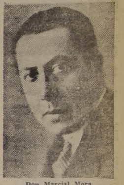
Don Marcial Mora

Hoy quedará designado el nuevo presidente nacional de la Unión para la Victoria en reemplazo de don Marcial Mora Miranda, que deberá alejarse del país para asumir el cargo de embajador de Chile ante el Gobierno de los Estados Unidos.