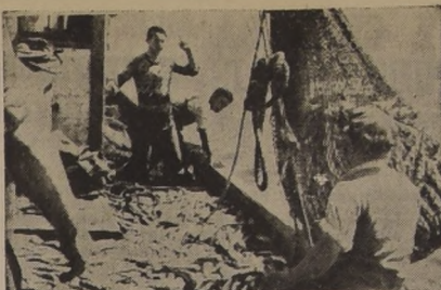
LA RIQUEZA DEL MAR CHILENO