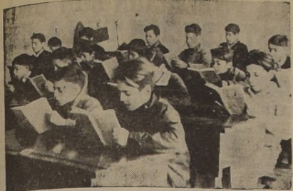
HIJOS DE OBREROS EN LAS ESCUELAS