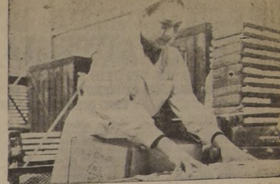
LA MUJER CHILENA EN LA FABRICA