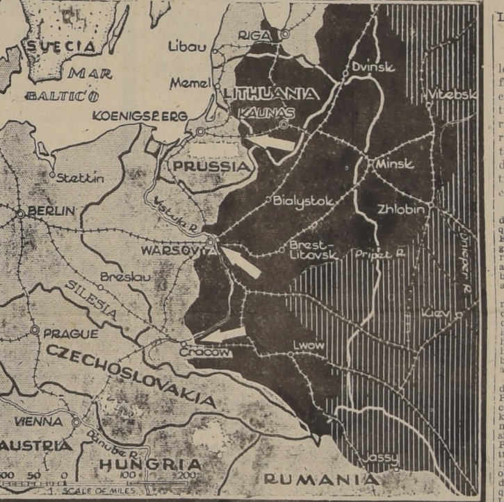
La zona negra señala aproximadamente el área recién conquistada por los rusos desde el 23 de junio último, fecha en que iniciaron la ofensiva combinada con el desembarco aliado en Normandía

LAS FORTIFICACIONES DEL BASTION ALEMAN FUERON FLANQUEADAS Y DESTRUIDAS