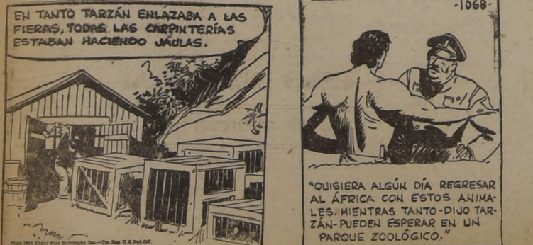
EN TANTO TARZAN ENLAZABA A LAS FIERAS, TODAS LAS CARPINTERIAS ESTABAN HACIENDO JAUJAS.