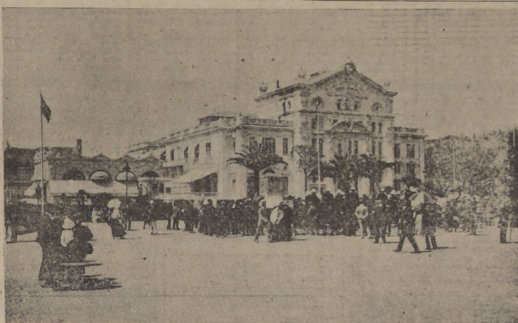
El Casino de Cannes.

¿AVANCE AMERICANO HACIA PARIS POR CHARTRES Y DREUX?