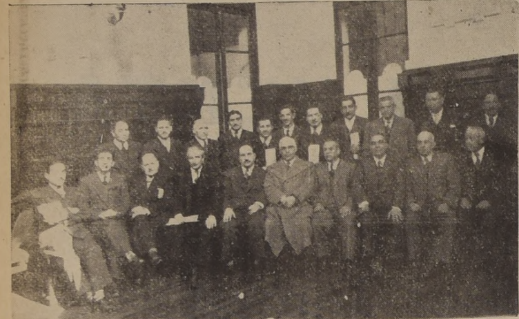
Grupo de delegados de provincias que concurrieron a las dos concentraciones

lidad sobre la marca del precio del calzado es exclusiva de los fabricantes. Enumeró y detalló diferentes casos particulares de comerciantes que la Asociación debería lograr satisfacer, como el caso de algunos comerciantes de Curicó y Barchalones, que habían sido sancionados erróneamente con multas pesadas, las que en algunos casos habían quedado pagas en otros se habían hecho efectivas a los fabricantes. Por último, el señor Bunster hizo un fervoroso llamado a la unidad nacional de los comerciantes del ramo para proseguir valientemente