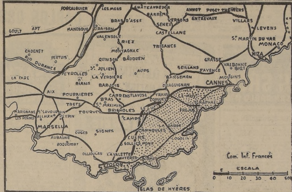
Las fuerzas aliadas han hecho una profunda penetración de más de 55 kilómetros hacia el interior de Francia por el Sur, a lo largo de un frente de 120 kilómetros. Durante este avance han caído en su poder importantes centros poblados, mientras las fuerzas nazis se cierran sobre la gran base naval de Tolón y el puerto de Cannes, cuya ocupación sería inminente. La zona grisada corresponde aproximadamente al territorio conquistado hasta las primeras horas de la madrugada de hoy.

ROMA 17.—(U. P.).—(Por James Roper).— Tanques alemanes penetraron en una parte de Florencia, dando muerte a soldados civiles y carabinieri italianos. El Gobierno militar que está funcionando bien en la mayor parte de la ciudad, se encuentra bajo el control aliado, pero los patriotas; inmensa por el reino del terror continúa en la sección dominada por los alemanes, manteniéndose allí una situación alimentada grave. Se prohíbe que se lleve armas en Florencia, con excepción de los Carabineros. A lo largo del río Arno, entre Empoli y el recodo de Pontassieve hubo un pequeño cambio de posiciones, habiendo sido destruidas las unidades del Octavo Ejército por extensos campos de minas, puentes volados y otras demoliciones. Una poderosa patrulla aliada irrumpió en Uguzzano por la vía meridional del Arno, cinco kilómetros al oeste de Florencia. En el sector de Prato Magna las patrullas estuvieron activas y los aliados ocuparon San Croce, situada a tres kilómetros al norte de Anghiari. En los demás sectores del frente del Octavo Ejército, hubo poca actividad. En el frente del Quinto Ejército numerosas patrullas crocadas por los nazis, que continuaron su fuego de artillería, morteros y ametralladoras.