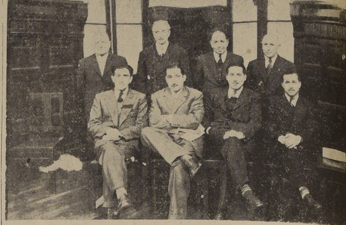
Miembros de las Directiva Nacional y de los comerciantes concentrados en Talca

realizada por el aseo de sus calzadas, la belleza de su plaza y la alegre armonía de su edificación, se sirvió en los amplios salones del Club Unión Social, un aperitivo a todos los señores delegados. Luego después, en uno de los comedores del Club, los visitantes fueron obsequiados con un gran banquete, que hizo resaltar una vez más la proverbial hospitalidad de los talquinos. En todo momento reinó un espíritu de cordial jovialidad, que hizo más grato el momento disfrutado en compañía de los anfitriones.