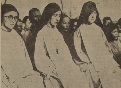
Monjas católicas de la Isla de Saipan oyen misa por vez primera, desde que los japoneses abolieron el culto católico en la isla, en 1940. El culto católico se ha restablecido con la conquista de Saipan por las tropas de Estados Unidos.