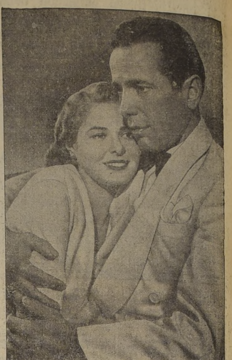
Una escena de la gran producción Warner Bros, "Casablanca", que protagonizan Humphrey Bogart e Ingrid Bergman, película que ha sido considerada como la mejor del año, y que será estrenada muy pronto en nuestras pantallas.