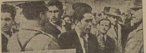
Algunos de los detenidos por carabineros durante las incidencias de ayer.

EN LOS MOMENTOS EN QUE SE RENDIA UN HOMENAJE AL PADRE DE LA PATRIA, DON BERNARDO O'HIGGINS