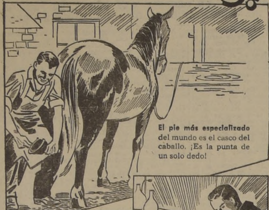
El pie más especializado del mundo es el casco del caballo. ¡Es la punta de un solo dedo!

Inspectores especiales revisan las hojas en la fábrica Gillette. Ud. se asegura una afetada rápida y suave cuando usa la Hoja Gillette-Azul legítima.