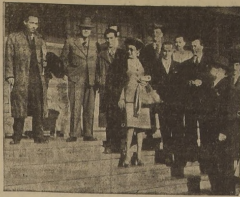
Desde ayer se encuentra en nuestra capital la conocida cantante Toña la Negra, que arribó en el avión de itinerario de la Panagra...