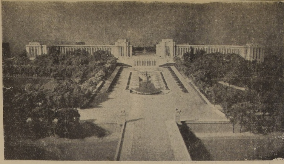
Perspectiva del nuevo Trocadero