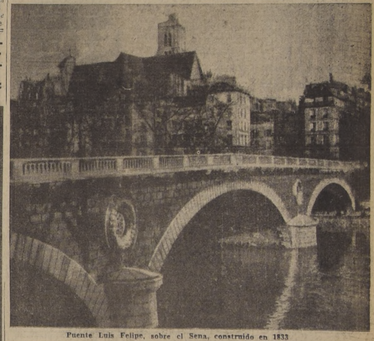
Puente Luis Felipe, sobre el Sena, construido en 1833