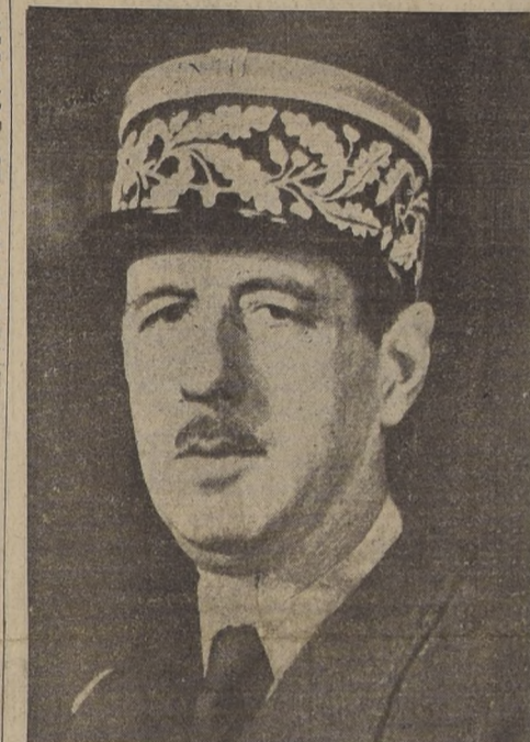
El general Charles de Gaulle, el heroico líder de la Francia combatiente.

En toda institución prevalece una tendencia orgánica a la rutina y, por lo tanto, al retroceso y a la ineficiencia. No es precisamente la institución militar la que se halla exenta de ese peligro. El constante manejo de ciertas fórmulas como la disciplina y la jerarquía, no puede menos de afectarla indirectamente o por asociación en el orden más elevado de las propias concepciones. Porque toda idea sobre todo si es nueva o si es innovadora, tiene algo de subversivo. Cuando, ante el fracaso del academismo de que hacía gala el ejército francés, Reynaud nombró al general De Gaulle Subsecretario de la Defensa Nacional, Blum supo justipreciar el significado de esa designación. Frente a De Gaulle el frente de los servicios de la Rue Saint Dominique, dijo en "Le Populaire", importa un acto casi revolucionario, y no por la juventud del novel director, ni por lo reciente de su ascensión al generalato.