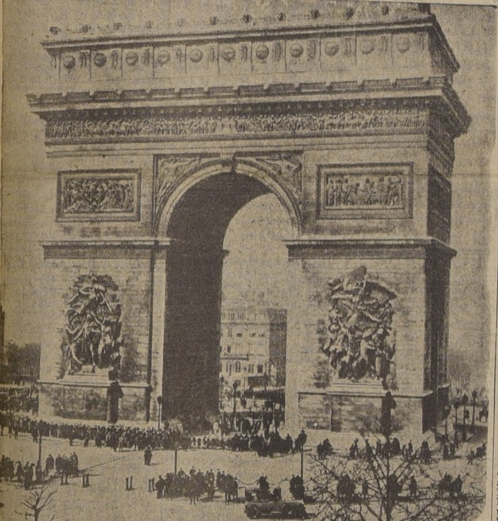
El célebre Arco del Triunfo, que conmemora las glorias del Primer Imperio, y que presenció el regreso triunfal de FOCH en la pasada guerra mundial.