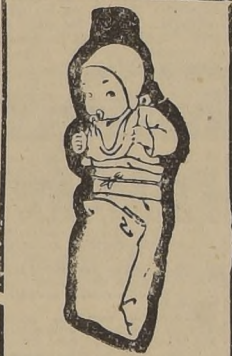
Eleva la dignidad del trabajador, dignificando sus propios hijos, cuyos adelantos le proporcionarán satisfacciones y glorias inditas, es el programa que realiza el Patronato Nacional de la Infancia.