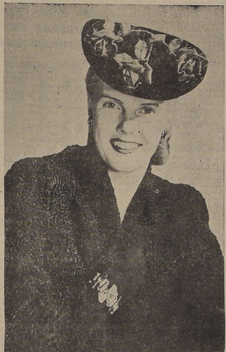
Sombrero taurino de ala picara, para caras picaras. Terciopelo negro, tres flamanés, rosas y velo, $ 27, original Bendel. (Corte, sia de Henri Bendel, la casa de la moda fina, Nueva York