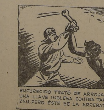
ENFURECIDO TRATÓ DE ARROJAR UNA LLAVE INGLESA CONTRA TARZAN, PERO ÉSTE SE LA ARREBATÓ.