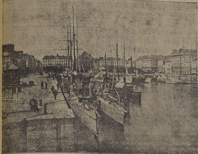
Vista del puerto de Le Havre