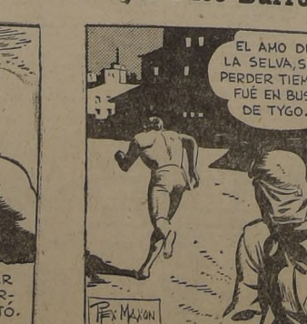
EL AMO DE LA SELVA, SIN PERDER TIEMPO, FUÉ EN BUSCA DE TYGO.