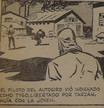
EL PILOTO DEL AUTOGIRO VIÓ INDIGNADO COMO TYGO, LIBERTADO POR TARZAN, HUIA CON LA JOVEN.