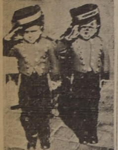
Los enanos América y Argentina, que actúan únicamente en el Circo Norteamericano Flying Behrs

El gran Circo Norteamericano que han traído a Chile los afamados trapecistas del Madison Square Garden de Nueva York. Los Flying Behrs, que está funcionando en el amplio local de Alameda con el Portal Edwards, en el terreno del ex Teatro Politeama, se ha convertido en el espectáculo cirensé de