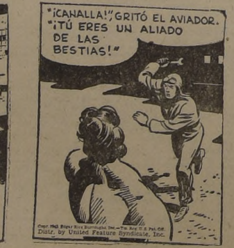
"¡CANALLA! GRITÓ EL AVIADOR. 'TÚ ERES UN ALIADO DE LAS BESTIAS!'"