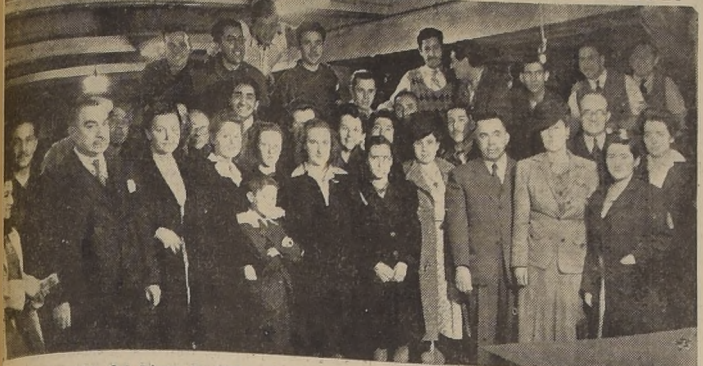
La delegación del Liceo de Niñas de Osorno, que ayer visitó LA NACION, durante su recorrido por los talleres