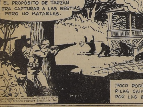
EL PROPOSITO DE TARZAN ERA CAPTURAR A LAS BESTIAS PERO NO MATARLAS. (POCO PODIA HACER) LOS GORILAS CAIAN ATRAVESADOS POR LAS BALAS.