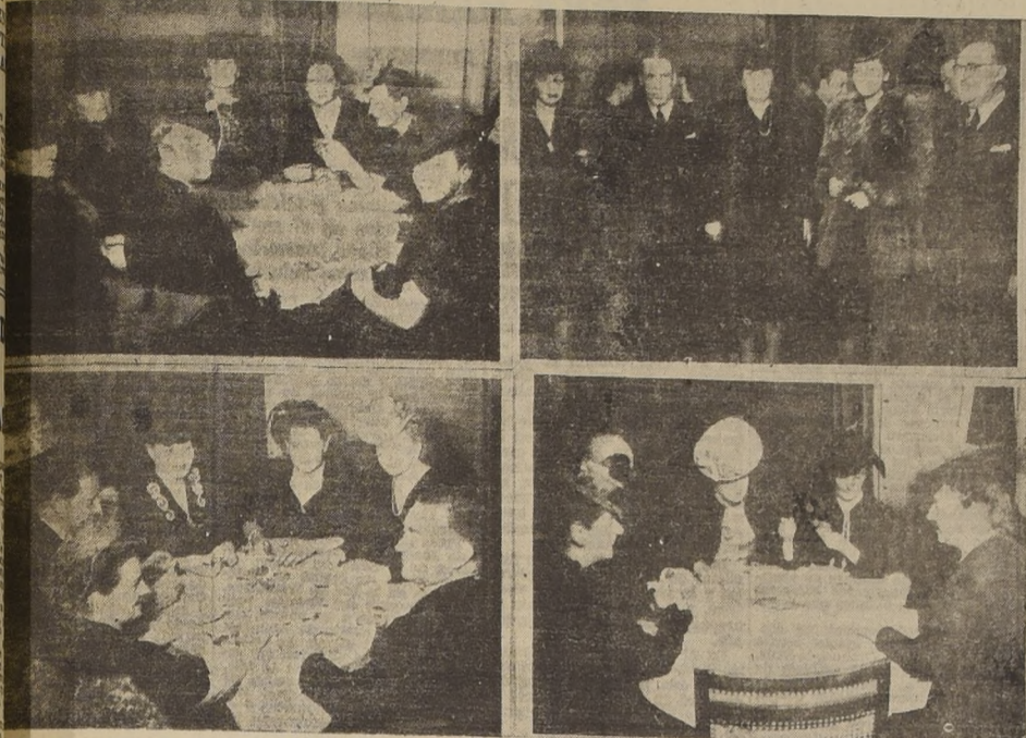
Impresiones tomadas por nuestros fotógrafos durante el Brasil y organizado por la esposa del Excmo. señor de Souza Neufeld de las obras sociales de la