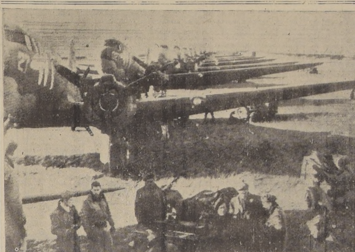
Primera flota de Dakotas, que aterrizó en un nuevo aeródromo aliado cerca del corredor en Holanda, con abastecimientos para las tropas que luchan en el área de Arnhem.

MOSCÚ 3. — (U. P.) (Por Henry T. Shapiro). — Las fuerzas rusas que avanzan para cortar la ruta de escape de los alemanes hacia Hungría, establecieron otra cabecera de puente a través del Danubio hacia Yugoslavia, llegando a un punto situado a unos 57 kilómetros de Belgrado en Ujljma, en tanto que otras tropas soviéticas penetraron en Checoslovaquia, y en el frente de Leningrado las fuerzas de esa región obtuvieron una victoria de grandes proporciones, con la atronadora conquista en una operación lanzada a través del mar, de la gran isla de Dago en el golfo de Riga.