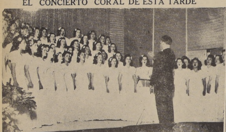
El Coro Polifónico de la Escuela Normal de Angol, que actuará esta tarde en el Teatro Municipal