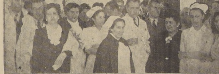
Diversos aspectos de la celebración del "Día del Hospital" efectuado ayer. En primer término, el Excmo. señor Juan Antonio Ríos durante su visita al Hospital de El Salvador. Centro: personal de ese establecimiento se entrega con entusiasmo a dicha celebración. Abajo: en el Hospital San Borja