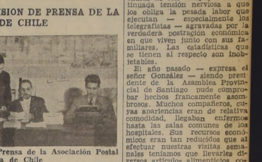
Miembros de la Secretaría de Prensa de la Asociación Postal y Telegráfica de Chile

NOS DICE EL SECRETARIO GENERAL DE LA COMISION DE PRENSA DE LA ASOCIACION POSTAL Y TELEGRAFICA DE CHILE