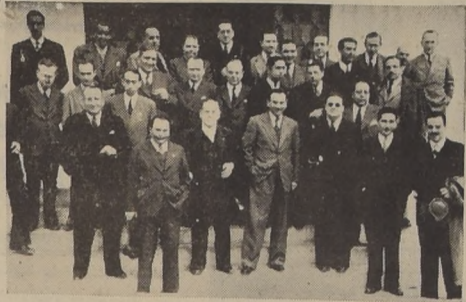
Asistentes al almuerzo ofrecido ayer a la prensa de Santiago por la Sociedad Nacional de Agricultura

UN RECUERDO DE LAS PRIMERAS EXPOSICIONES Desde las 9 horas de hoy estará abierta al público la 74.ª Exposición de Animales, importante torneo ganadero que organiza anualmente la Sociedad Nacional de Agricultura en la Quinta Normal y que alcanza brillantes resultados por los valiosos ejemplares de fina sangre que exhiben los criaderos más importantes del país.