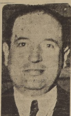
Presidente de la Cámara de Diputados, señor Sebastián Santander