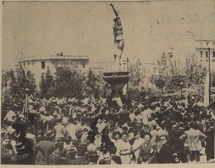
Parte de la concurrencia que asistió al acto de ayer