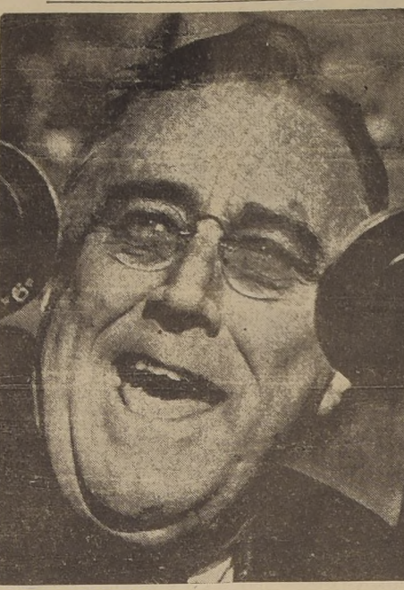
Estados Unidos, "han sido alentados y robustecidos por la sangre derramada juntos contra el enemigo común. Esos vínculos hallan una brillante confirmación en el grande y espontáneo apoyo que nos ha prestado la noble nación norteamericana en nuestra actual y trágica lucha".

Después de afirmar que España se sentía orgullosa de haber crecido un continente y de referirse al espléndido futuro de la "espiritualidad, lenguaje y raza española", Leguía dijo: "Hay allí otra ilustre raza europea, cuya expansión y labor a través del Atlántico han creado pueblos de proporciones físicas y espirituales colosales que marchan hoy a la cabeza de la civilización. Pleno especialmente en Estados Unidos, con quienes el mundo español mantiene y siempre mantendrá relaciones amistosas y de mutua cooperación y amistad."