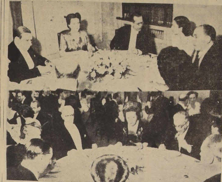
Ayer a las 21.30 horas, se efectuó en el Salón de Honor de la Sociedad Nacional de Agricultura la comida que el Consejo de la institución ofrecía en homenaje a las delegaciones extranjeras...