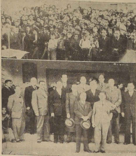
Durante el acto celebrado ayer en la Población "Lo Franco". Abajo, dirigentes del Rotary Club que concurrirán a la entrega de los premios.