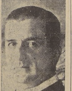
ese frente en apoyo de los nazis. En vista de esta actitud incluída, Horthy declaró la guerra a Hungría el 6 de diciembre de 1941. Cooperaba con su Gobierno una Cámara Alta y un partido único

El almirante Nicolás Horthy de Nagybánya nació en 1868. Ejerció desde 1920 el cargo de Regente del reino vacante de Hungría. En 1919, cuando Bela Kun proclamó la "Comuna Húngara", Horthy organizó una fuerza militar que destruyó dicho régimen. Se proclamó entonces Regente con el título de "Administrador del Reino", y resistió todas las tentativas de restauración del trono iniciadas por Carlos de Habsburgo y su heredero. Orientó su política hacia los estados totalitarios y en 1938, a raíz de la desmembración de Checoslovaquia, logró fuera anexada a Hungría una parte de Eslovaquia. En 1939 consiguió la Rusia Subcarpática y en 1940 una gran parte de la Transilvania, posesión hasta ese momento por Rumania, país que se vio obligado a cederla bajo la presión de Alemania e Italia.