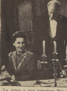
La joven y rica heredera Prudence Jathaway (Joan Fontaine), de contra los deseos de su aristocrática familia, doner permiso en una noche de oscuridad, alistándose al servicio de su patria en la División de