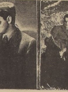
(Tyronne Power), cuyas extrañas ideas no scaba de comprender, pero con el que simpatiza desde el primer momento. En su segundo encuentro le sorprende una tormenta, buscando entonces refugio en un pajar, donde la si-