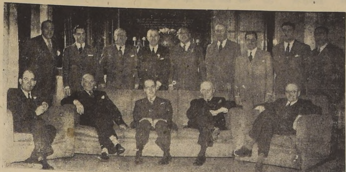
Asistentes al almuerzo con que se celebró el tercer aniversario de la constitución de la Sociedad Anónima Yatur, manufacturera chilena de algodón

El Embajador especial del Uruguay y Sra. de Regules ofrecieron una recepción.