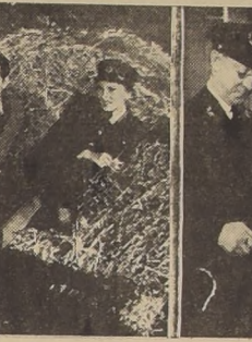
tuación se presta a las confidencias, que van convirtiendo insensiblemente su innata simpatía en amor sincero, sin que ninguno de los dos se dé cuenta del rumbo a que este amor ha de llevarlos. Cuando Prudence tiene

su primera licencia como "soldado" para reunirse unos días con su familia, ella y Clive toman un tren para dirigirse a una playa a pasar una semana juntos. (Continuará mañana).