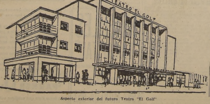
Aspecto exterior del futuro Teatro "El Golf"