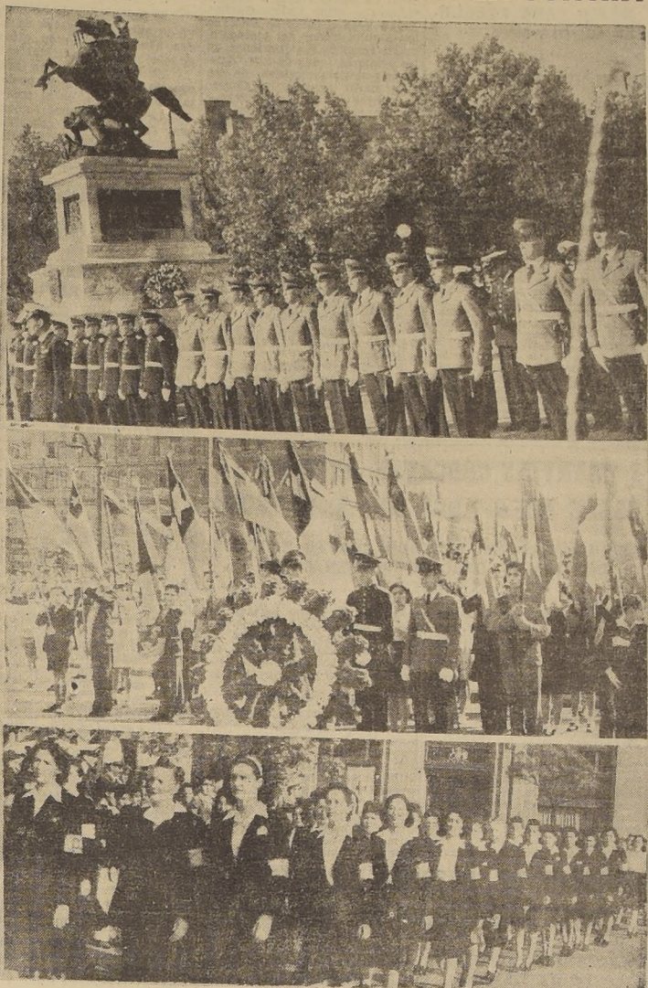
Tres aspectos del acto de ayer frente al monumento de O'Higgins, uno de los números principales de la Semana del Niño, en el día de Homenaje a La Patria.