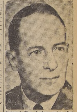
General Mac Arthur quien dirige personalmente las operaciones