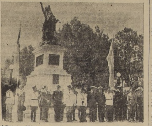
Adictos militares argentinos y jefes de las Fuerzas Armadas en el acto de ayer