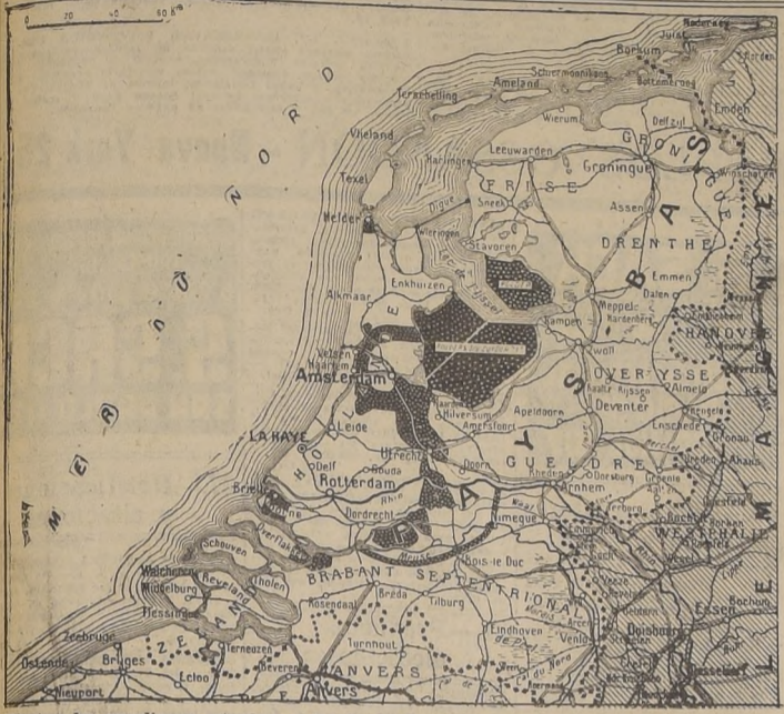
Mientras los canadienses estrechan el bolsillo del Escalda y redoblan la ofensiva destinada a dejar libre la entrada del puerto de Amberes, los ingleses del 2.º Ejército que comanda el general Dempsey, han entrado al estratégico centro de comunicaciones de Hertogenbosch (Bois-le-Duc) y han iniciado una embestida encaminada a cercar a los alemanes y acelerar su expulsión de los Países Bajos.