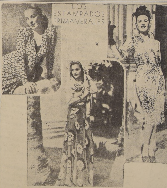
1. Traje drapé de crepe negro y blanco, adornado con cinta de terciopelo negro, que cae en forma de lazo. 2. De influencia hindú es esta combinación de falda larga y amplia con flores estampadas, y el chal, que recuerda el "sari". 3. Vestido de crepe con fondo azul celeste y diseño floral azul marino. La capucha es de la misma tela.