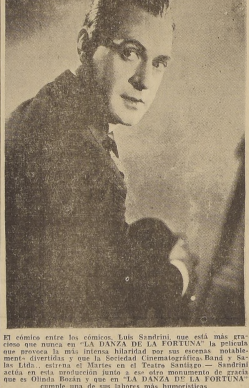
El cómico entre los cómicos, Luis Sandrini, que está más gracioso que nunca en "LA DANZA DE LA FORTUNA"

que es Olinda Bozán y que en "LA DANZA DE LA FORTUNA" cumple una de sus labores más humorísticas