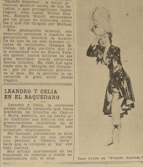
Joan Leslie en "Triunfo Supremo"