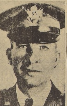
General Bradley, comandante del Primer Ejército norteamericano.