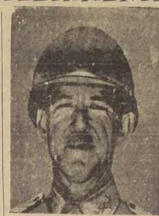
General Courtney Hodges, Comandante del Primer Ejército Norteamericano