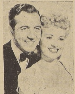
del conflicto entre bastidores, tiene más sentido de la belleza femenina: sabe como ganar la partida, y no sorprende a nadie ver que, al final, es éste Don Juan quien conquista el corazón de la muchacha.

La nueva película de la 20th Century Fox, "LAS PIERNAS MANDAN", que se estreña hoy en las tres funciones del Teatro Normandie, nos ofrece una nueva versión del eterno triángulo amoroso. Componen éste los populares artistas Betty Grable, John Payne y Victor Mature. Pero lo original es la consabida contienda entre los rivales. Usan como armas de lucha, nada menos que los guantes de boxeo. El joven y bien formado Victor Mature se presenta como campeón y John Payne no tiene más remedio que tratar de ponerse a su altura. Victor Mature, sin embargo, habiéndose metido en camisas de once varas, al final se convence de que en el escenario no mandan precisamente los guantes, aunque sean éstos los de un campeón. En las tablas "mandan las piernas" y así se lo demuestra la estrella de la revista, Betty Grable, la de las piernas divinas. John Payne el apuesta contra John Payne, que figura entre los personales del conflicto entre bastidores, tiene más sentido de la belleza femenina: sabe como ganar la partida, y no sorprende a nadie ver que, al final, es éste Don Juan quien conquista el corazón de la muchacha.