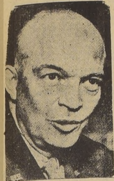
General Eisenhower, comandante supremo de las fuerzas aliadas