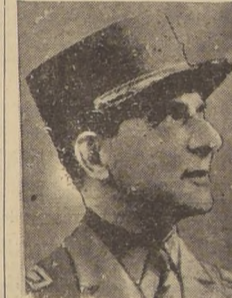
General de Lattre de Tassigny, que dirige el Primer Ejército francés

escasa oposición, capturó Horn, 3,5 kilómetros distante de Roermond, y llegó a Haalen cinco kilómetros al noroeste de Roermond; la infantería que operó al sur del canal de Dombro progresó su rápido progreso y llegó a unos tres kilómetros del canal de Zig, que parece ser a línea hacia la cual se retira el enemigo. En el extremo meridional, el Séptimo Ejército operando al noreste de Baccarat liberó St. Pöl, después de dura lucha, y continuó su presión al sur de Bruyeres, por donde los nazis se repliegan. Inmediatamente al norte de la frontera suiza las tropas francesas avanzaron liberando diez o más poblados en un progreso de ocho kilómetros a lo largo de un frente de casi 40 por ambas riberas del Doubs; esta noche estaban a ocho kilómetros de Mont Bellard, que protege los accesos septentrionales del Paso de Bel fort; estas fuerzas liberaron Mar Vesle, Montenois, Lougny, Ecot y Eueurey entre otros puntos.