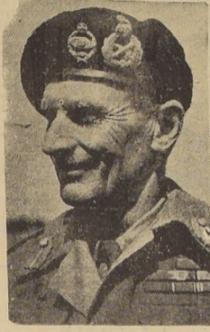
Mariscal Montgomery, jefe de los ejércitos anglo-canadienses.