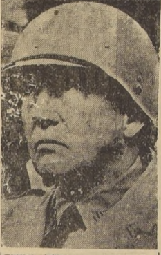
General Patton, comandante del Tercer Ejército de E. U.