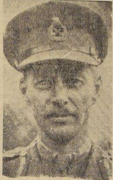
General Sir Miles C. Dempsey, al mando del 2.º Ejército británico.