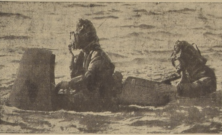
Terpedo humano británico momentos antes de sumergirse.