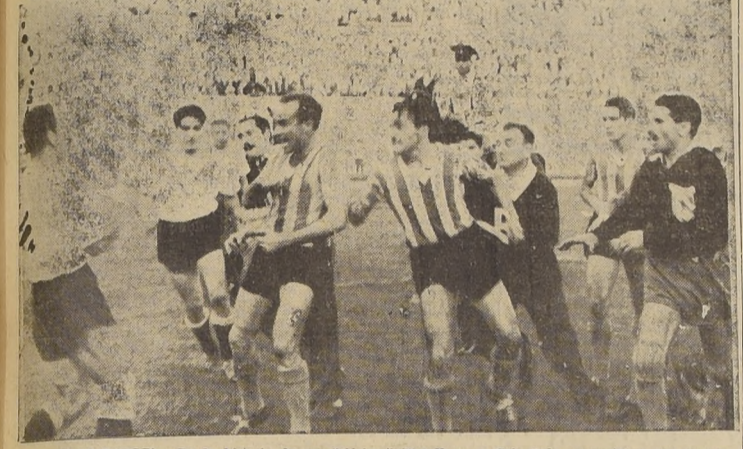
QUE DESAGRADABLE.— En la historia de sus "clásicos" Magallanes y Colo Colo no contaban con un cuadro como el que ofrecieron Hornos y Tormazal para luego abofetearse. Puno se apresó también a intervenir y el entrenador Platko a impedir que continúe el bochornoso incidente. Las tácticas contemplan conocimientos de box?

A expectativa que había despertado el partido de Magallanes y Colo Colo, más la extremada importancia que le dieron los propios jugadores, influyeron de una manera decisiva para que este encuentro considerado como el "clásico" del fútbol nacional se viera ayer con el interés de una serie de incidentes y que terminaron con un desorden de graves proporciones. Estamos ciertos que el público que concurre al Estadio Nacional pudo imaginarse cualquier cosa, menos que el match iba a tener un desarrollo tan desolador y que sus protagonistas se colocarían en un marco tan ageno a lo que deben ser estos espectáculos. Por lo pronto, necesario será referirse a que lo sucedido no es sino una consecuencia del ambiente intranquilidad exagerada en que se han desarrollado las actividades del fútbol profesional estimuladas en