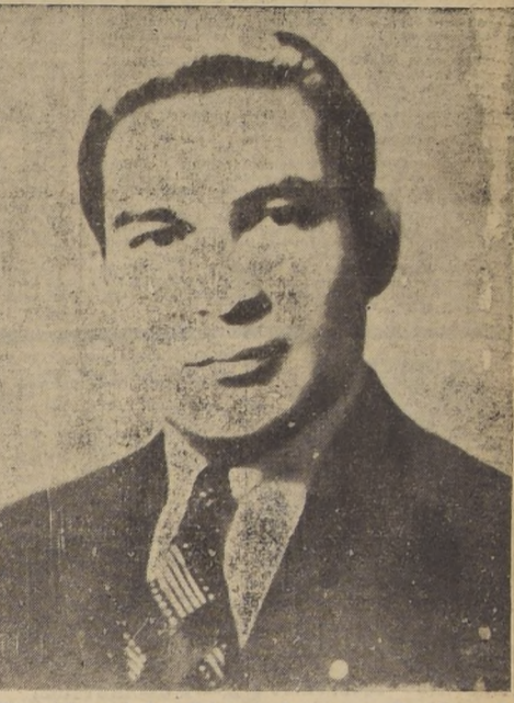
Mayor General don Fulgencio Batista, ex Presidente de Cuba, que llega hoy a la país

En 1931 se produce en Cuba un clima de inquietud política, que culmina con un alzamiento militar. Fulgencio Batista está con los elementos de