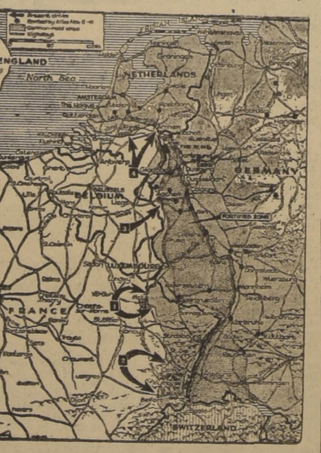
Las flechas, señaladas con el N.º 2, indican la dirección de las ofensivas del 7.º Ejército americano y del 1.º Ejército francés. De la más abajo, señala el avance francés a través del paso de Belfort, que ha terminado en las orillas del Rin frente a Basilea. Las señaladas con el N.º 1, indican el movimiento envolvente emprendido por el III Ejército americano que ha terminado victoriosamente con el cerco de la plaza de Metz. El 3.º corresponsal de Aquisgran, donde el Primer Ejército de E. U., ha abierto una brecha de 37 kilómetros en las líneas Siegfried, y, finalmente, el N.º 4, señala las embestidas del 2.º Ejército inglés.