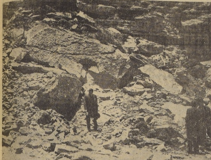
Aquí está la materia prima que alimentará la planta de cemento de Juan Soldado, y que bastará para trabajar ochenta años en una producción de 240 mil toneladas anuales

MR. J. FITCH, REPRESENTANTE DEL EXIM BANK Y MIEMBROS DE LA CORPORACION RECORRIERON ESTA PLANTA DE CEMENTO, QUE ES LA MAS MODERNA DEL MUNDO