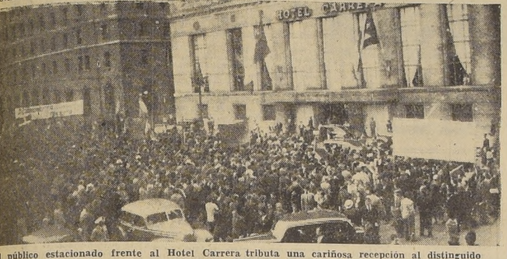
El público estacionado frente al Hotel Carrera tributa una cariñosa recepción al distinguido visitante

BATISTA ACLAMADO En los momentos en que el señor Batista y comitiva abandonaban la cancha, el numeroso público estaciona-