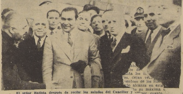
El señor Batista después de recibir los saludos del Canciller y otros funcionarios