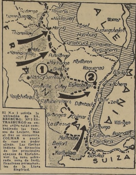
El N.º 1 señala la ubicación de SA. REBURG; N.º 2, Estrasburgo. En estas calles están combatiendo las fuerzas de Leclerc. Más al Sur se encuentra COLMAR a punto de caer en poder aliado. Las flechas indican la dirección de los principales ataques de Eisenhower. La zona sombreada indica la zona de fortificaciones permanentes de la Línea Siegfried.

EL DR. GUANI HABLARA SOBRE FRANCIA A LA AMERICA LATINA Hoy, el doctor Guani, Vicepresidente de la República del Uruguay, hablará por radio sobre Francia.