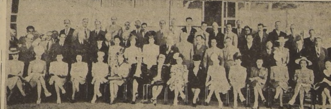
Asistentes al almuerzo ofrecido por el directorio de la Sociedad Chilena de Pediatría a las delegaciones extranjeras al Congreso, y que se sirvió ayer en el Golf