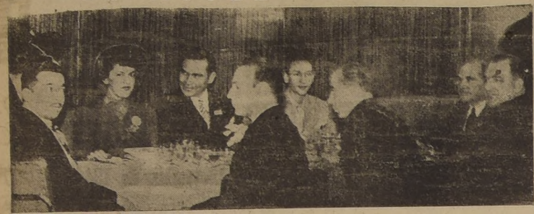
El ex Presidente de Cuba, general señor Fulgencio Batista, con un grupo de invitados, en el Grill Room del Hotel Carrera