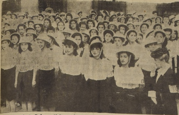
Voluntarias de la Defensa Civil con los nuevos cascos donados por la institución similar de Londres

(DE LA 1.ª PAGINA) agradeció el obsequio en los siguientes términos: "Cumple en primer lugar agradecer el honor que se nos dispensa con la presencia de S. E. el Vicepresidente de la República, y de los altos señores de las naciones amigas, asistentes, pero muy especialmente de recalcar el honor que significa al tener aquí, en este acto, al gran democrata y ex-Presidente de la querida hermana República de Cuba, y organizador de la Defensa Civil cubana, el general don Fulgencio Batista. Esta ceremonia tiene para la Defensa Civil de Chile una doble y grande importancia. La importancia material del gesto de esa noble nación, al enviar por sobre tierras que se estremecen a cada instante con bárbaras explosiones, pasando