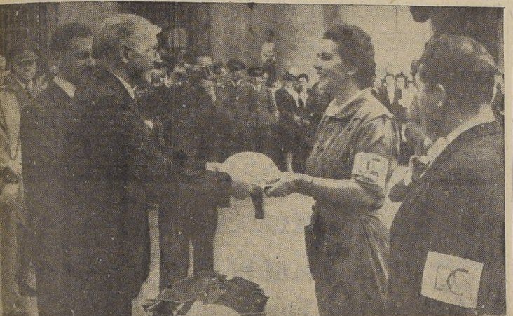
El Embajador de Gran Bretaña, Excmo. Sir Charles Orde, entrega su casco a una voluntaria de la Defensa Civil

Se presume que el cadáver del malogrado militar boliviano será traído a Arica, para practicar la autopsia médico-legal. — EL CORRESPONSAL