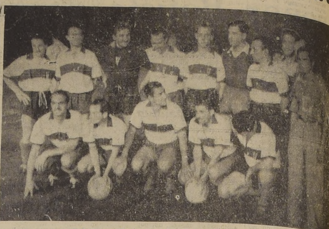
UNIVERSIDAD CATOLICA.— Presionó en los primeros 45 m', pero después parece que el tiro se agotó y el arco de Livingstone pasó por serios momentos de apuro.