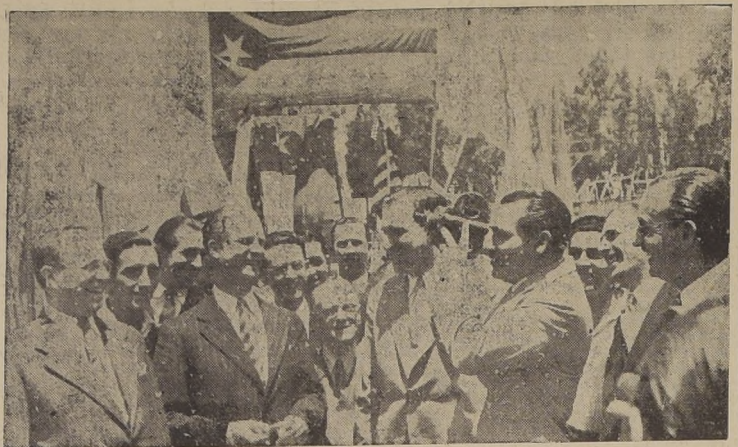
El General Batista filma una escena durante su visita a la Chile Films.

ANOCHÉ SE DIRIGIO POR FERROCARRIL A CONCEPCION