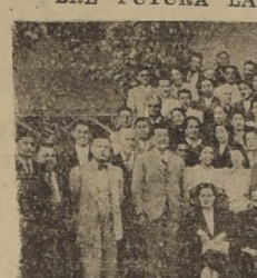
Grupo de profesores de Huasco y Freirina durante la concentración efectuada en Valenar

ESTUVIERON REUNIDOS DURANTE CUATRO DIAS EN VALLENAR A INSINUACION DEL INSPECTOR JURISDICCIONAL. — ACUERDOS ADOPTADOS SOBRE FUTURA LABOR EDUCACIONAL