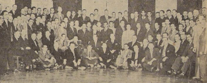
Grupo de asistentes a la comida ofrecida en el Hotel Carrera, con motivo de celebrar el Día del Constructor, organizada por el Sindicato de Contratistas y Constructores de Chile.