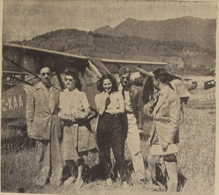
Pasajeros en el Aeropuerto del Gran Hotel Termas de Puyehue...