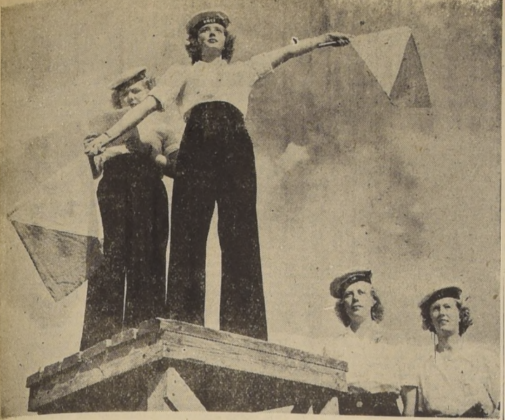
Estas simpáticas Wrens (miembros de la división naval femenina de la Marina Canadiense), se han especializado en el servicio de señales y comunicaciones. En el grabado aparecen enviando un mensaje por medio de banderolas.