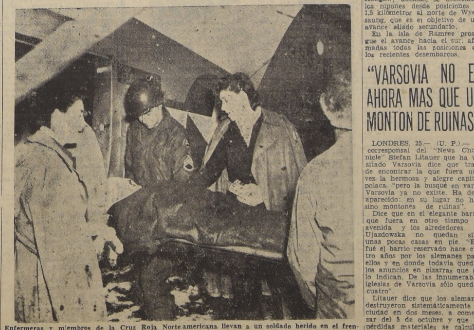
Enfermeras y miembros de la Cruz Roja Norte americana llevan a un soldado herido en el frente occidental por vía aérea a Inglaterra. Desde la invasión anglo-americana al continente europeo, por vía aérea se han transportado más de cien mil heridos desde las zonas de combate.