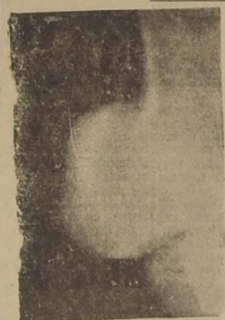
Radiografía sacada el 21 de septiembre de 1944: muestra una total consolidación de la fractura

Jera si había alguna posibilidad de sanarlo.