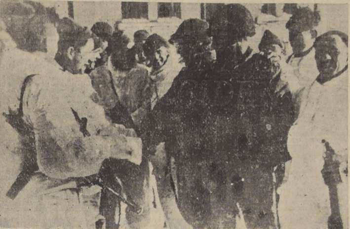
Los británicos (en uniformes blancos para camuflaje) y patrullas americanas se reúnen en Champlon, en las Ardenas.

Esta maniobra específica se ha considerado como un posible nuevo intento para desequilibrar el frente occidental, y es allí donde únicamente retienen los nazis la iniciativa. Tras un avance de ca-