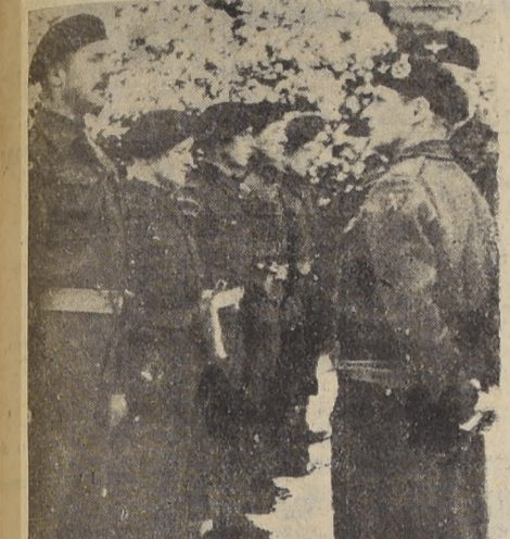
El Mariscal de Campo Montgomery, recientemente nombrado Comandante del Regimiento Paracaidista, pasando revista a las tropas de la Sexta División, que han mantenido un sector de la línea contra el saliente alemán.

200 mil nazis han quedado cercados en Prusia Oriental