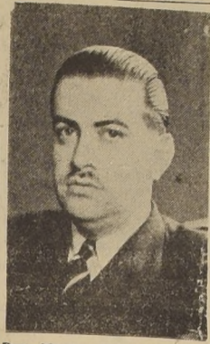
Don Manuel Casanueva, Ministro de Agricultura