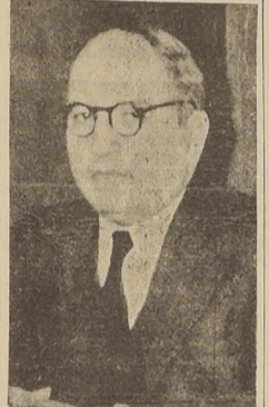
Don Gustavo Lira Manso, actual Ministro de Obras Públicas y Vías de Comunicación, a quien le corresponde la ejecución de las obras contempladas en el Plan.