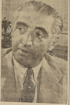
Excmo. Sr. Juan Antonio Ríos, que trabajó incansablemente hasta obtener el despacho del Plan Extraordinario de Obras Públicas, cuya ejecución ha de traer para el país incalculables beneficios.