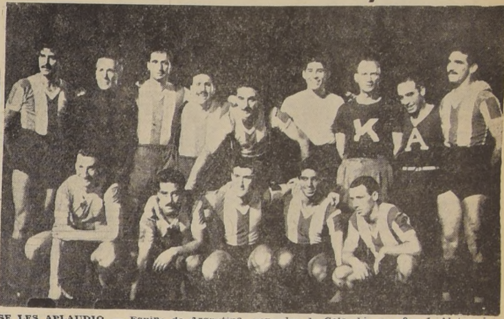
SE LES APLAUDIO. — Equipo de Argentina, vencedor de Colombia por 9 a 1. Al término del encuentro, el público supo premiar la exhibición de los albicelestes

Argentina: SALOMON. Colombia: MENDOZA. Brasil: ADEMIR. Uruguay: MASPOLI.