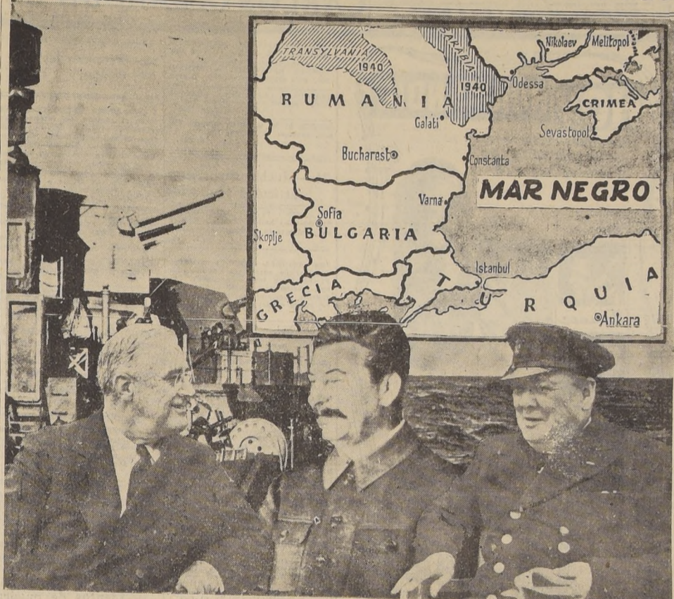
Un comunicado oficial de origen aliado ha venido a confirmar las informaciones acerca de la reunión de los tres grandes, aunque no indica el sitio preciso de la conferencia, pues se limita a señalar que las conversaciones se efectuaron en la zona del Mar Negro. Noticias procedentes de Alemania sugieren la posibilidad de que Roosevelt, Churchill y Stalin estén reunidos a bordo de un buque de guerra. Otras informaciones del mismo origen indicaban el puerto rumano de Constanza como probable lugar de la reunión.

MOSCU, 7. — (U. P.). — Por Henry T. Shapiro. — Se ha iniciado la batalla de Berlín. Desde la cabeza de puente sobre la ribera occidental del Oder, el ejército de la capital alemana, el ejército soviético está destruyendo las defensas exteriores de la ciudad.