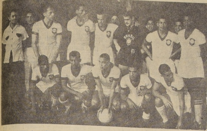
GANO 3 POR 0. — Representación del Brasil, que anoche se impuso en forma concluyente a la de Uruguay, por 3 goles contra 0