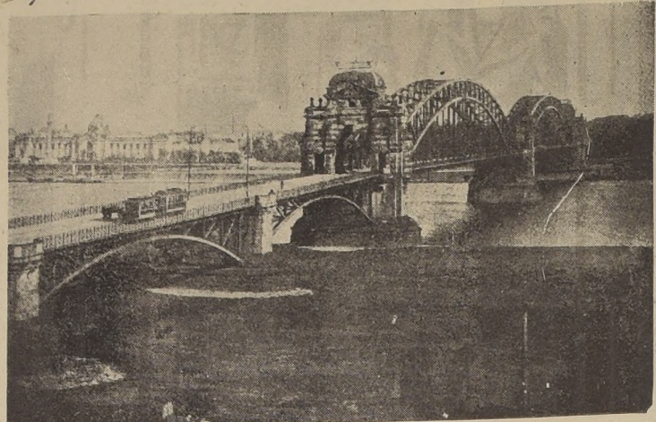
El puente de Duesseldorf que cruzaron las tropas americanas, según las informaciones procedentes de Berlín, aún no confirmadas por los Aliados.

Las puntas de lanza anglo-canadienses avanzan rápidamente hacia otros puentes aún intactos