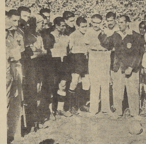
VIANNA.— El referee brasileño, Mario Vianna, que aquí vemos dando instrucciones a colombianos y uruguayos, demostró falta de carácter y de criterio. Por su culpa hubo serios incidentes. No actuó en lances de trascendencia.

Dos triunfos consiguió el Deportivo Campaña y Zamora en la presentación cumplida el sábado último, frente al club Supe. En el primero, su primer elenco se impuso por el estrecho score de 2 a 1 y el segundo, por 2 tantos a cero.