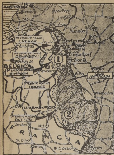
Las flechas indican las principales acometidas aliadas.