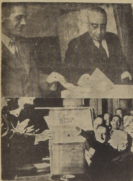
Los ex Presidentes de la República, señores Juan E. Montero y Arturo Alessandri Palma, son captados por nuestro reportero gráfico en el momento que cumplen sus deberes cívicos en las mesas receptoras de la 1.ª Comuna.