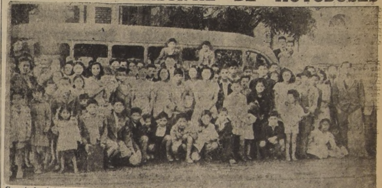
Con todo éxito se lleva a efecto el segundo paseo a las playas ofrecido por el Departamento de Bienestar Social del Sindicato de Dueños de Autobuses...