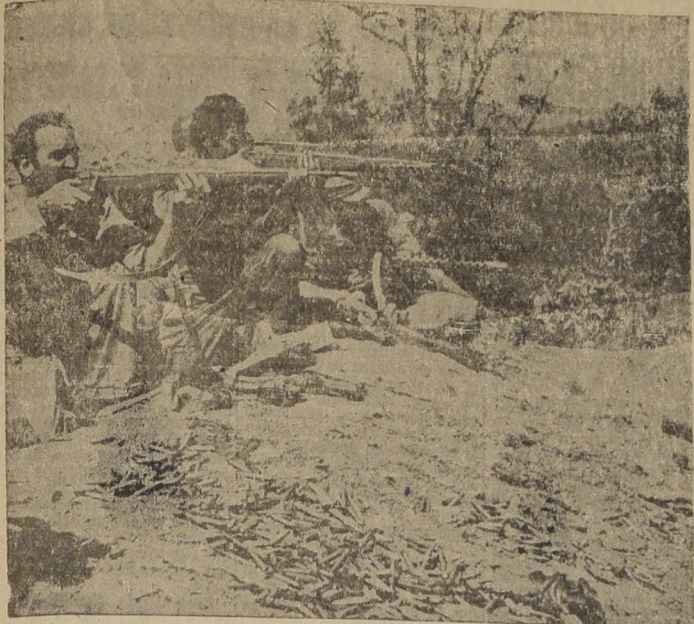
Infantes norteamericanos combatiendo a los nipones en la ruta de Burma entre Wanting y Lashio. Uno de los combatientes usa una mira telescópica. Los Estados Unidos ya han abastecido la llamada Ruta Stilwell hacia la China, por la cual afluye abastecimiento a Chung-king.