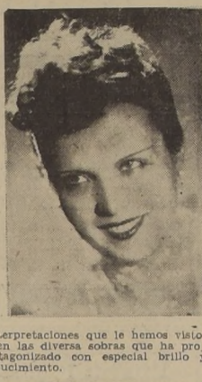
MIRTHA LEGRAND EN "LA CASTA SUSANA"